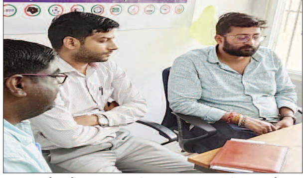
ऑनलाइन सेवाओं का लाभ एक ही अक्सर पर विभागीय सचिव ने कहा कि सरकार का उद्देश्य है कि आम

केटी न्यूज/बक्सर जिले के बुनियाद केंद्रों को आम नागरिकों के लिए और अधिक उपयोगी बनाने की दिशा में महत्वपूर्ण पहल करते हुए विभागीय सचिव बुनियाद प्रेसिडी ने बक्सर एवं डुमरांव स्थित बुनियाद केंद्र परिसर में कॉमन सर्विस सेंटर (सीएससी) की सेवाओं का उद्घाटन किया। इस पहल के बाद अब बुनियाद केंद्र एकीकृत सेवा प्रदाता केंद्र के रूप में कार्य करेंगे, जहां आने वाले लाभार्थियों को विभिन्न सरकारी एवं