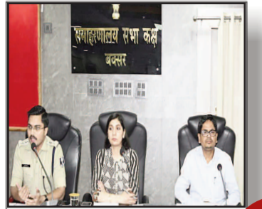
सिविल न्यायालयों में परिचर-चपरासी भर्ती की प्रारंभिक परीक्षा 15 मार्च को, 16 केंद्रों पर 8444 अभ्यर्थी होंगे शामिल

प्रमुख खबरें : दिल्ली ■ पटना ■ बक्सर ■ शाहाबाद ■ मगध