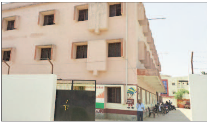
मॉडल भवन में आठ कमरे और चार बड़े हॉल हैं। जहां नगर परिषद अलग-अलग विभागीय कार्यों का बंटवारा कर कामों का

डुमरांव नगर परिषद क्षेत्र में वार्डों की बढ़ोतरी होने के बाद नगर परिषद प्रशासन ने अपने विभागीय कार्यों में भी बदलाव लाया है। शहर के करीब एक लाख की आबादी को नवीन सुविधा और सुचारु रूप से काम करने के लिए नए कार्यालय को नये भवन में शिफ्ट किया है। यह भवन एनएच 120 सड़क स्थित प्रखंड कार्यालय के समीप निर्मित है। ढाई करोड़ की लागत से बने इस