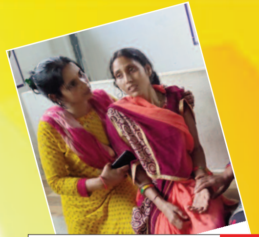
पत्नी का इलाज कराने जा रहे कंपाउंडर की सड़क दुर्घटना में मौत