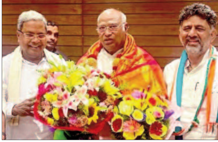
चुनाव में मिली जीत के बाद कांग्रेस के राष्ट्रीय अध्यक्ष को सम्मानित करते पार्टी नेता।

देश की राजनीति में करीब एक दशक से 'हिंदुत्व' कार्ड की जबरदस्त आंधी चली है। राजनीति में क्षेत्रीय विषमता और अस्मिता, दोनों को समेटने के लिए भाजपा ने 'हिंदुत्व' का कार्ड खेला। काफी हद तक उसे कामयाबी भी मिल गई। कुछ समय पहले तक यही माना जा रहा था कि भाजपा के सफल होने का एक बड़ा कारण दिशाहीन 'कांग्रेस' पार्टी भी है। जहां भी चुनाव होता, वहीं इस दल के कई गुजर आने लगते। वोटों को लगाने लगा था कि कांग्रेस पार्टी किसी भी वर्ग के लिए उपयोगी साबित नहीं हो रही। विपक्ष को भी साथ नहीं ले पा रही। इन सबके चलते भाजपा ने तो यह मान लिया था कि 'कांग्रेस मुक्त भारत' मिशन खत्म हो चुका है, अब राज्यों के मजबूत क्षेत्रीय दलों की बारी है। यह सवाल भी उठने लगा कि विपक्षी दलों का नवीनीकरण हो पाएगा या वे इतिहास बन कर जाएंगे। कर्नाटक की जीत ने कम से कम विपक्षी दलों, खासतौर पर कांग्रेस के नवीनीकरण की राह प्रशस्त की है। हालांकि अभी ये शुरुआत भर है।