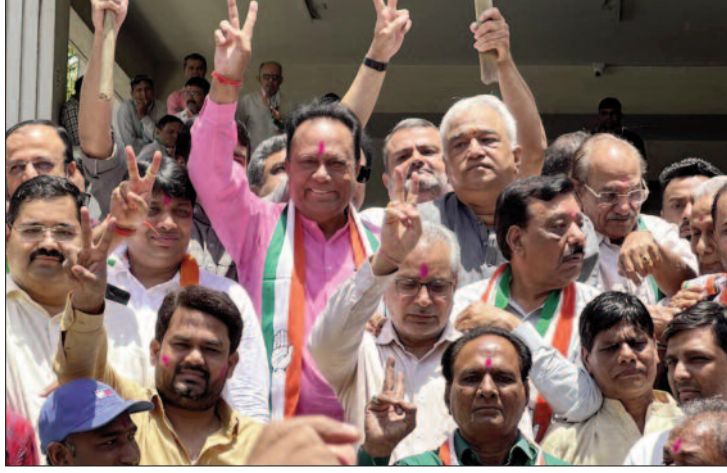
कर्नाटक विधानसभा चुनाव में मिली जीत के बाद खुशी मनाते कांग्रेस कार्यकर्ता।

कर्नाटक विधानसभा चुनाव के नतीजों में कांग्रेस किंग बनकर उभरी है। 224 सीटों पर हुए चुनाव में कांग्रेस ने 136 सीटों पर जीत दर्ज कर स्पष्ट बहुमत हासिल कर लिया है। इस चुनाव में मोदी मैजिक पूरी तरह फेल रहा। पीएम मोदी की धुआंधार जनसभाओं के बावजूद भाजपा को वहां की जनता ने सिर से नकार दिया। पीएम मोदी के राज्य में कुल 25 चुनावी कार्यक्रम किए। इसमें रैली, जनसभा और रोड शो शामिल थे। मोदी ने अपने चुनावी कार्यक्रम में 19 जिले कवर किए जिनमें 164 विधानसभा सीटें पड़ती हैं। जनसभा, रैली में लोगों की भीड़ तो उमड़ी लेकिन यह वोट में तब्दिल नहीं हो सकी। इसी का नतीजा रहा कि भाजपा यहां कोई कमाल नहीं कर सकी और महज 65 सीटों पर सिमटकर रह गई।