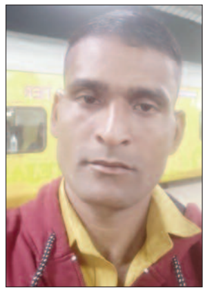
लाखां रूपए लेकर भागनेवाला ठग।