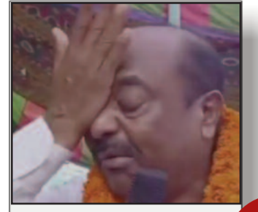
मंच पर ही सेने लगे राजद नेता, टिकट कटने से नाराज थे पूर्व सांसद

प्रमुख खबरें : दिल्ली ■ पटना ■ बक्सर ■ शाहाबाद ■ मगध