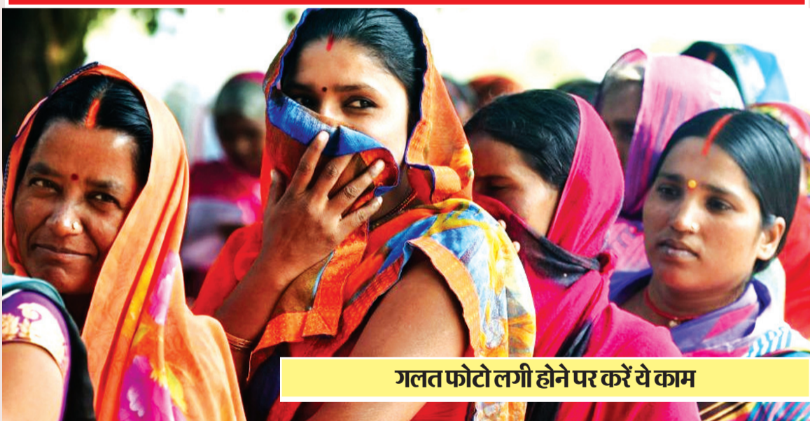
गलत फोटो लगी होने पर करें ये काम

19 अप्रैल से देश में लोकसभा चुनाव के मतदान की शुरुआत होगी। अब मतदाताओं के लिए बड़ी राहत भरी खबर है। चुनाव आयोग ने कहा कि अगर किसी मतदाता के पास वोटर कार्ड नहीं है तो उसे अन्य फोटो युक्त पहचान पत्र से अपनी पहचान को सत्यापित करना होगा। इसके बाद वह अपना मत डाल सकेगा। मगर मतदाता सूची में नाम का होना जरूरी है। उल्लेखनीय है कि देश में लोकसभा चुनाव सात चरणों में होंगे। वहीं अरुणाचल प्रदेश, सिक्किम, ओडिशा और आंध्र प्रदेश में विधानसभा चुनाव भी हो रहे हैं।