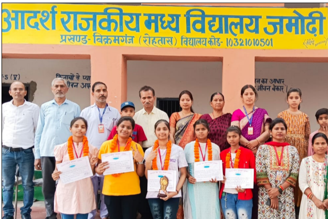
आदर्श राजकीय मध्य विद्यालय जमोड़ी प्रखण्ड-विक्रमगंज (रोहतास), विद्यालयकोड- 10.32.10.10501