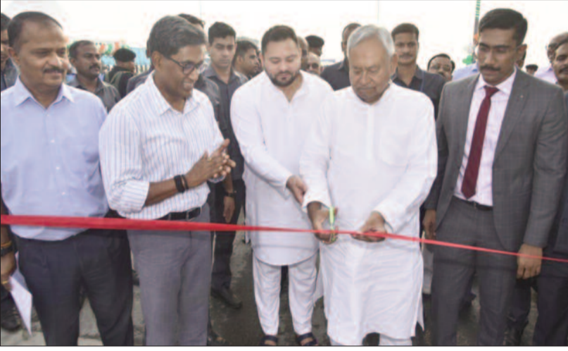
दरभंगा में जो जमीन चुनी गई है, उसी पर बनाना होगा एम्स: सीएम

बिहार के मुख्यमंत्री नीतीश कुमार ने स्वतंत्रता दिवस की पूर्व संध्या पर पटनावासियों को तोहफा दिया। नीतीश कुमार ने अपने ड्रीम प्रोजेक्ट जेपी गंगा पथ फेज-2 ( पटना मरीन ड्राइव ) का उद्घाटन किया। इस मौके पर बिहार के डिप्टी सीएम तेजस्वी यादव भी मौजूद रहे। जेपी गंगा पथ फेज-2 के चालू हो जाने से लोग अब दीघा से गायघाट तक आसानी से पहुंच सकते हैं। गायघाट तक आने में लोगों को अब रोड जाम का सामना नहीं करना पड़ेगा। उद्घाटन के साथ जेपी गंगा पथ फेज-2 पर आवागमन शुरू हो गया है। बता दें कि जेपी गंगा पथ परियोजना की शुरुआत 11 अक्टूबर 2013 को नीतीश कुमार ने ही किया था। फेज वन और फेज टू का नीतीश कुमार ने उद्घाटन कर दिया। शेष बचे आठ किलोमीटर पर काम चालू है। अनुमान है दिसंबर अंत तक फेज थ्री का भी उद्घाटन कर दिया जाएगा। इससे पहले दीघा से पीएमसीएच तक शुरू किया गया था। अब इसे बढ़ाकर गायघाट तक कर दिया गया है। बता दें कि पहले दीघा से गायघाट पहुंचने में दो घंटे लगते थे, लेकिन अब 20 मिनट में ही लोग यह दूरी तय कर लेंगे। उद्घाटन समारोह को देखते पहुंचे पटनावासी बहुत खुश थे। पटनावासियों ने मुख्यमंत्री नीतीश कुमार को धन्यवाद दिया।