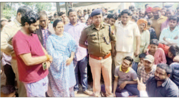
घटना के बाद सड़क जाम कर रहे ग्रामीणों को समझाते अधिकारी