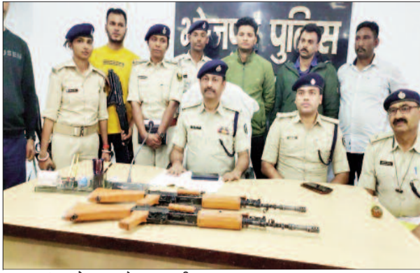
बरामद इंसान के साथ भोजपुर एसपी व अन्य

झारखंड के पश्चिमी सिंहभूम जिले के जमेशदपुर के आदित्यपुर सीआरपीएफ कैंप से चोरी गयी दोनों इंसान राइफल मोजपुर से बरामद कर ली गयी। इंसान लेकर भागने में इस्तेमाल कार भी जब्त की गयी है। हालांकि राइफल लेकर भागने वाला