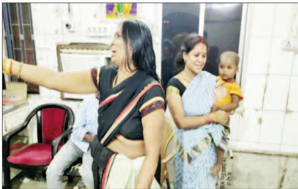
अस्पताल में आक्रोशित महिलाएं