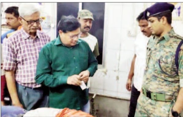
जानकारी लेते एससी