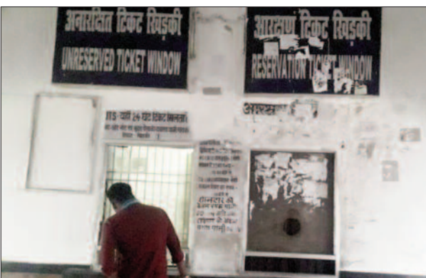
बंद पड़ी आरक्षण टिकट की खिड़की

एक हफ्ते से भवैया रेलवे स्टेशन की आरक्षण खिड़की बंद है। यात्रियों को टिकट नहीं मिल रहा है। लोग भटक रहे हैं। बता दें कि कोरोना का कठिन दौर भले ही खत्म हो गया हो, लेकिन रेल विभाग की सुविधाएं अब भी बेपत्ती हैं। कई रूटों पर न ही सभी ट्रेनों का नियमित संचालन हो रहा है और न ही आरक्षित टिकट आसानी से मिल रहा है। ट्रेनों में यात्रा करने वालों को रोज चुनौतियों का सामना करना पड़ रहा है। यह स्थिति पीडीडीयू-दनापुर रेल