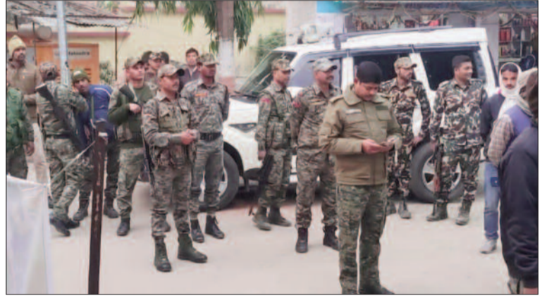
मारे गए तीनों बदमाश पलामू के हैदरनगर के रहने वाले

मौब लिंगिचिंग पार्किंग को लेकर विवाद के बाद कार सवार बदमाश ने गोली मारकर एक व्यक्ति की कर दी हत्या घटना के बाद गुस्साईं भीड़ ने कार सवार तीन बदमाशों को पीट-पीटकर मार डाला, तीन की हालत गंभीर