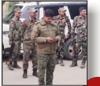
कार पार्क करने को लेकर हुई मारपीट और फायरिंग में चार लोगों की मौत