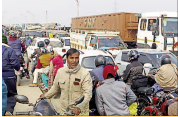
मकर संक्रांति पर श्रद्धालुओं ने लगाई गंगा में डुबकी

निकलना मुनासिब समझे। ग्रामीणों ने बताया कि गाजीपुर जिला मुख्यालय की ओर से बीते रविवार की देर रात को एक खाली ट्रैलर सुहवल की तरफ आ रहा था कि लगाए गए हाइड्रो ज बैरियर के समीप राजमार्ग के बीचों बीच खराब हो गया। काफी प्रयास के बाद भी उसकी मरम्मत नहीं हो सकी। सुबह होते ही उसके दोनों तरफ वाहनों की काफी लंबी कतार लगने से भीषण जाम लग गया। लोगों ने बताया कि रजागंज पुलिस के द्वारा मनाही के बाद भी बड़े वाहनों को छोड़ दिया गया। इस तरह के जाम से लोगों को दोपहर तक सामना करना पड़ा। राहगीरों ने बताया कि पिछले कई महीनों बाद इस तरह के जाम के जाम से लोगों को जूझना पड़ा है। इस संबंध में थानाध्यक्ष संतोष कुमार राय ने बताया कि मार्ग के बीच में ही ट्रैलर के खराब होने से यह स्थिति बनी। फिलहाल जाम को समाप्त करा यातायात बहाल करा दिया गया है। वहीं दूसरी ओर ठंड के कारण आम लोगों को काफी परेशानी का सामना उठाना पड़ा। जो भी लोग मकर संक्रांति के लिए निकले थे। वह इस जाम में फंसे रहे। करीब तीन घंटे बाद राहत मिली।