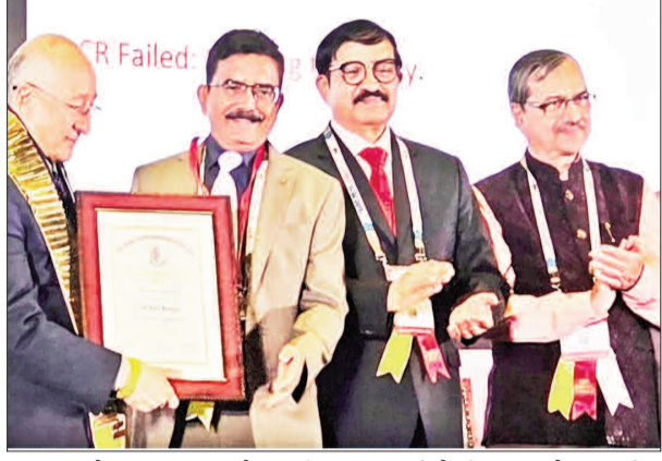
ऑथॉरिटी ऑफ़ इन्फ़ॉर्मेशन (एआईओसी) 84वें वार्षिक सम्मेलन में 12 से 15 मार्च तक प्रदर्शनी सह सम्मेलन केंद्र (जेईसीसी) में विशेष चिकित्सकों की टीम ने भाग लेंगे। जो आयोजित कार्यक्रम राजस्थान में ऑथॉरिटी ऑफ़ इन्फ़ॉर्मेशन के नेतृत्व में पूरे विश्व का सबसे बड़ा नेत्र विज्ञान सम्मेलन के रूप में हुई। जिसमें उन्नत नेत्र देखभाल अनुसंधान, कार्यशालाएं और वैज्ञानिक शामिल हैं। जो नए सत्र के मुख्य प्रारूप में एआईओसी, प्लास-3 मुख्य रहा।

■ एआईओसी के 84वें सर्वश्रेष्ठ सम्मेलन की मिली बड़ी उपलब्धि