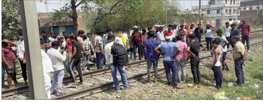
केटी न्यूज/डुमरांव शनिवार को डुमरांव रेलवे स्टेशन के पास उस समय अफरा-तफरी मच गई, जब रेलवे ट्रेक पर एक महिला का शव मिलने से कुछ देर के लिए रेल परिचालन बाधित हो गया। स्टेशन के पूर्वी फाटक के समीप डाउन मेन लाइन पर ट्रेन की चपेट में आने से महिला की मौत हो गई। शव पटरी पर पड़े होने के कारण पटना से मुंबई जा रही सुविधा एक्सप्रेस को करीब 14 मिनट तक डुमरांव स्टेशन पर ही रोके रखना पड़ा।

पूर्वी फाटक के पास डाउन लाइन पर हुआ हादसा, पहचान नहीं होने से बड़ी गुत्थी; दुर्घटना या आत्महत्या पर जांच शुरू घटना शनिवार सुबह करीब 11:30 बजे की बताई जा रही है। जानकारी के अनुसार पोल संख्या 644/14 और 644/16 के बीच अचानक एक महिला ट्रेन की चपेट में आ गई। प्रत्यक्षदर्शियों के मुताबिक ट्रेन गुजरने के बाद पटरी पर महिला का शव पड़ा देखा गया, जिसके बाद आसपास के लोगों में हड़कंप मच गया। रेलवे ट्रेक पर शव होने की सूचना मिलते ही स्टेशन प्रशासन और रेलवे पुलिस को इसकी जानकारी दी गई।