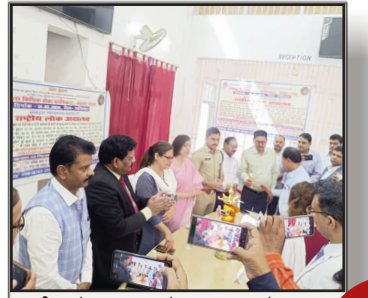
राष्ट्रीय लोक अदालत में 1708 मामलों का निपटारा साढ़े 14 करोड़ से अधिक की राशि पर हुआ समझौता

प्रमुख खबरें : दिल्ली ■ पटना ■ बक्सर ■ शाहाबाद ■ मगध