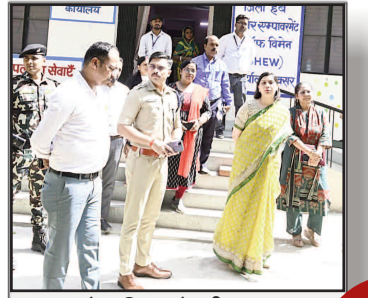
बक्सर में महिलाओं की सुरक्षा पर फोकस : वन स्टॉप सेंटर को और प्रभावी बनाने के निर्देश

प्रमुख खबरें : दिल्ली ■ पटना ■ बक्सर ■ शाहाबाद ■ मगध