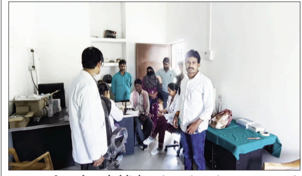
■ स्वास्थ्य विभाग की पहल से लोगों को मिला परामर्श, गंभीर मरीजों को बेहतर इलाज के लिए किया गया रेफर

केटी न्यूज/चौसा ग्रामीण क्षेत्रों में स्वास्थ्य सुविधाओं की पहुंच बढ़ाने के उद्देश्य से चौसा सामुदायिक स्वास्थ्य केंद्र (सीएचसी) की ओर से सरेंजा खेल मैदान के पास एक निःशुल्क नेत्र जांच शिविर का आयोजन किया गया। प्रभारी चिकित्सा पदाधिकारी के नेतृत्व में आयोजित इस शिविर में कुल 51 लोगों की आंखों की जांच की गई, जिससे स्थानीय लोगों को काफी राहत मिली। शिविर का मुख्य उद्देश्य गांवों में रहने वाले लोगों को आंखों से जुड़ी बीमारियों के प्रति जागरूक करना और उन्हें समय पर उचित चिकित्सा सलाह उपलब्ध कराना था। जांच के दौरान मरीजों की आंखों की बारीकी से जांच की गई और उनकी समस्याओं के अनुसार उन्हें आवश्यक परामर्श दिया गया। कई