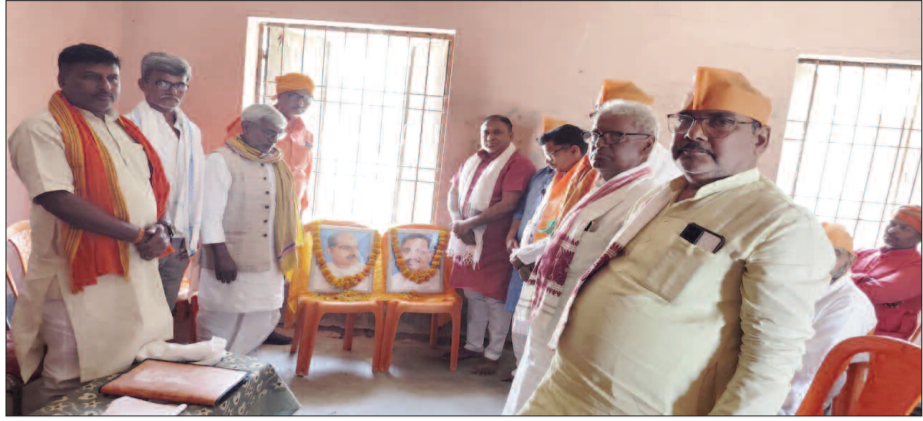
केटी न्यूज/सिमरी भारतीय जनता पार्टी द्वारा देशव्यापी स्तर पर चलाए जा रहे