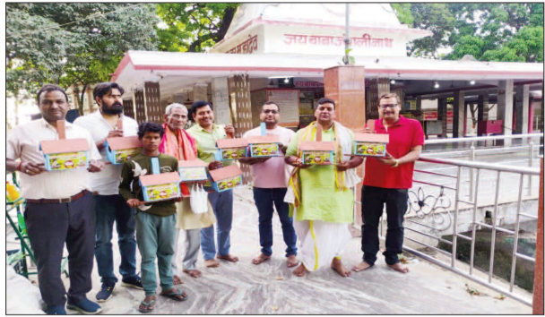
उठाया है। इस अभियान के तहत नगर के प्रमुख देवाल्यों में गौरैयों के लिए सुरक्षित बसेरा तैयार किया जा रहा है, ताकि इन नन्हें परिलों की चहचहाहट एक बार फिर शहर के वातावरण में गूंज सके। अभियान की

विश्व गौरैया दिवस से पहले रुद्रसागर सेवा संस्थान की पहल, शहर में बढ़ेगी पक्षी संरक्षण की जागरूकता