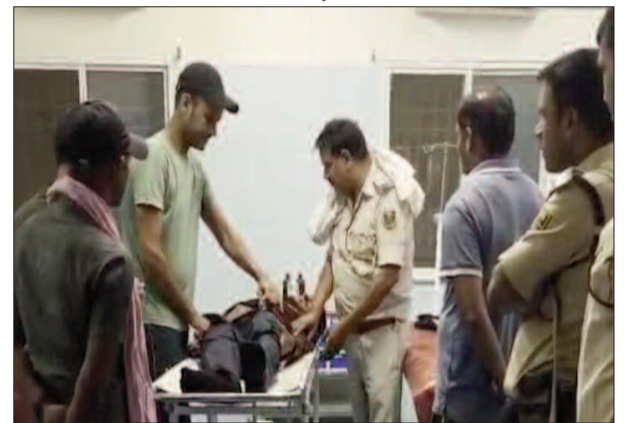
केटी न्यूज/चौसा मुफरिसल थाना क्षेत्र के चौसा-बक्सर मुख्य मार्ग पर तेज रफ्तार का कहर एक बार फिर देखने को मिला, जहां रविवार की देर रात एक तेज गति कार ने साइकिल सवार युवक को जोरदार टक्कर मार दी। इस दुर्घटना में युवक गंभीर रूप से घायल हो गया, जिसे प्राथमिक उपचार के बाद बेहतर इलाज के लिए सदर अस्पताल रेफर किया गया है।

■ यादव मोड़-बारा मोड़ के बीच हादसा, पैर में फ्रैक्चर, बेहतर इलाज के लिए सदर अस्पताल रेफर