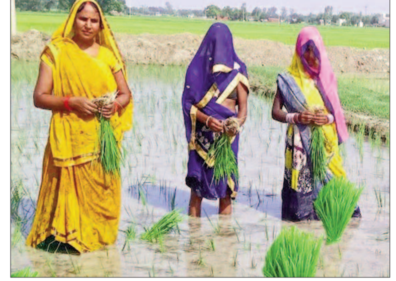
को याद करती हैं। ऐसे में उपजे अनाज खाने से शरीर पर सकारात्मक प्रभाव पड़ता है। डॉ.

खेतों में महिलाएं सालों से काम कर रही हैं। यह बात तो सब जानते हैं, लेकिन महिलाओं द्वारा खेत में निर्भाई जाने वाली परंपरा के बारे में बहुत कम लोग जानते हैं। दरअसल, धान की रोपाई करते हुए महिलाएं गीत के माध्यम से बहुत कुछ बयां करती हैं। धान के पौधे को जीवनदान देने समय ये महिलाएं कभी भगवान को याद कर रही हैं, तो कभी अपने पति को। ऐसा माना जाता है की खुशहाली और पुरानी परंपरा से तैयार होने वाला खाने वालों को अन्न सकारात्मक एनर्जी देता है।