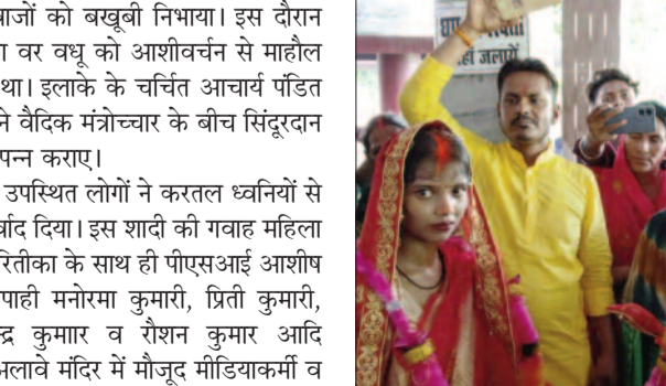
प्रेमी जोड़े का चार साल से चल रहा था प्रेम प्रसंग