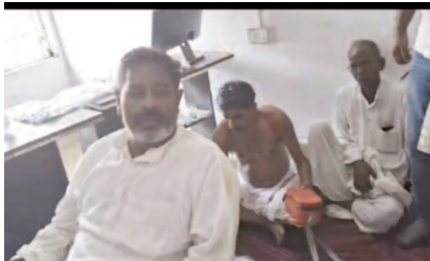
दो पक्षों के बीच 14 एकड़ भूमि पर चल रहा था विवाद