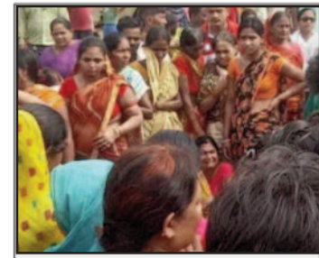
पटना में दो बच्चों की नृशंस हत्या, बेरहमी से पीटने के बाद निकाल ली गई थी आंखें