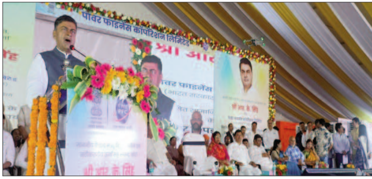
के सौजन्य से तीन करोड़ से अधिक राशि में बनकर तैयार होगी। जिससे पीरो क्षेत्र के लोगों को एक सुन्दर, स्वच्छ और सभी सुविधा जनक