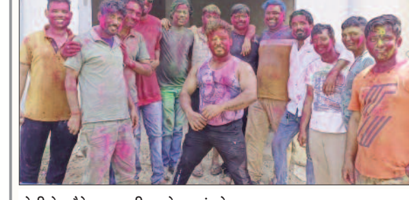
होली के मौके पर मस्ती करते डुमरांव के युवा।