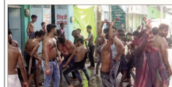
होली के गीतों पर नाचते युवाओं की टोली।