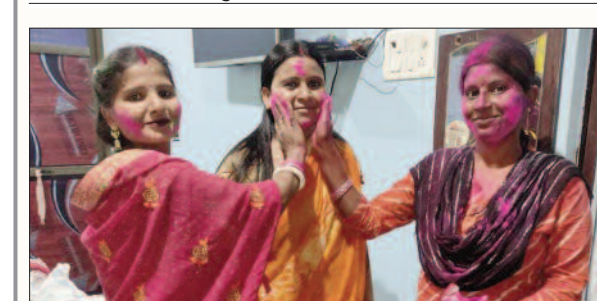
एक दूसरे को गुलाल लगा होली मनाती भाजपा नेत्री व अन्य।