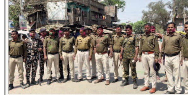
होली के दौरान नया भोजपुर चौक पर तैनात स्थानीय थाने की पुलिस।