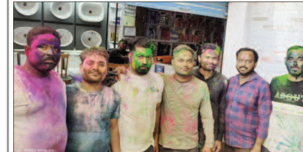
होली के मौके पर रंग अबीर खेल खुशी जताते युवा।