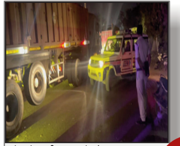
ओवरटेक की सनक में मौत : पुराना भोजपुर में ट्रक चालक ने प्रतिद्वंद्वी को रौंदा, गिरफ्तार

प्रमुख खबरें : दिल्ली ■ पटना ■ बक्सर ■ शाहाबाद ■ मगध