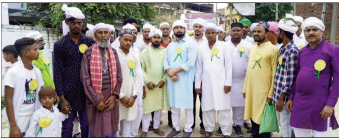
जुलूस में शामिल हुए नया भोजपुर के भी लोग...

जुलूस में शामिल लोगों ने बताया कि हम जिनकी पैदाइश में खुशी मना रहे हैं। उन्होंने पूरी मानवता के लिए पैगाम दिया है उसको आम करना व लोगों तक पहुंचाना है। इस्लाम धर्म इस बात की वकालत करता है कि सबसे बड़ा धर्म ईसानियत है। नबी की पैदाइश के बाद तमाम गलत रस्मों व समाज में होने वाले ऊंच-नीच के फर्क को मिटाया गया इन लोगों ने बताया कि जब ईद दुनिया में नबी तशरीफ लाएं तो उन्होंने बताया है कि वह जिंदगी अनमोल है अल्लाह की दी हुई है इसको किस तरीके से गुजारा जाए इसके तमाम तरीके बतलाएं साथ ही बड़े बुजुर्गों का अदब करना, गरीबों का हक दिलाना तमाम अच्छे काम करना जिंदगी का अहम पहलू है।