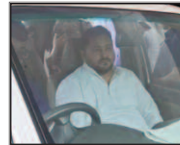
तेजस्वी ने पीएम मोदी, सीएम नीतीश और प्रशांत पर जमकर साधा निशाना