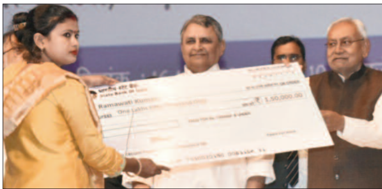
विशेष राज्य का दर्जा मिल जाए तो 2 साल में बदल जाएगा बिहार

इस मौके पर मुख्यमंत्री नीतीश कुमार ने अपने संबोधन में कहा कि वर्ष 2018 में मुख्यमंत्री अनुसूचित जाति-अनुसूचित जनजाति उद्यमी योजना शुरू किया गया था। इस योजना के तहत 10 लाख रुपये दिए जाते हैं इसमें से 5 लाख रुपये अनुदान और 5 लाख रुपये ब्याज मुक्त ऋण दिया जाता है। दो वर्षों में 4 हजार 674 युवक-युवतियों ने इसका लाभ लिया। वर्ष 2020 में जननावक कर्पूरी ठाकुर के जन्मदिन पर घोषणा की थी कि मुख्यमंत्री अनुसूचित जाति-अनुसूचित जनजाति उद्यमी योजना को तर्ज पर मुख्यमंत्री अति पिछड़े वर्ग उद्यमी योजना का लाभ दिया जाए। वर्ष 2021 में सात निश्चय पार्ट- 2 में हमने तब किया कि इन