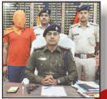
मुखिया पति हत्याकांड का मुख्य शूटर हथियार के साथ गिरफ्तार

प्रमुख खबरें : दिल्ली ■ पटना ■ बक्सर ■ शाहाबाद ■ मगध