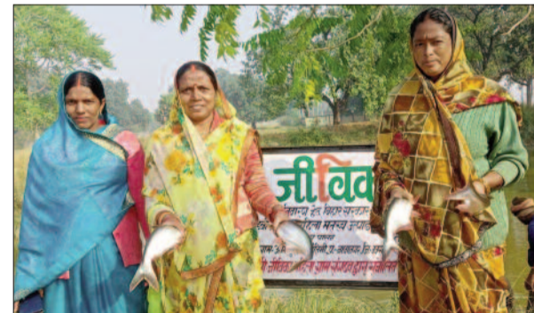
तालाब से निकली मछली को दिखाती जीविका दीदियां

प्रखंड के अंतिमी पंचायत में जीविका दीदियों ने महिलाओं को आत्मनिर्भर बनने की दिशा में पहल किया है। इससे जीविका दीदियों ने महिलाओं को आर्थिक रूप से सशक्त होने की दिशा में अग्रसर करने के साथ अपनी अलग पहचान बनाया है। जीविका विभाग नावानगर से मिली जानकारी के अनुसार उनके द्वारा गठित 'मोहनी जीविका महिला मत्स्य