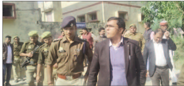
नवोदय विद्यालय में पहुंचे डीएम व अन्य अधिकारी

जिले के महुआर स्थित कसाया जवाहर नवोदय विद्यालय में विद्यार्थियों ने गुरुवार की सुबह समस्याओं को लेकर हंगामा किया। बालक छात्रावास भवन गेट पर सैकड़ों विद्यार्थी जमा हो गए। जो प्राचार्य के प्रति नाराजगी जताने के साथ शिक्षा व्यवस्था खराब होने व स्कूल में हो रही असुविधा को लेकर नारेबाजी करने लगे। मामले की जानकारी के बाद डीएम व एसपी, एमडीएम सदर मौके पर पहुंचे। उन्होंने छात्रों की समस्या सुनी और निराकरण का आशवासन दिया। इसके बाद विद्यार्थी गेट से वापस हॉस्टल चले गए।