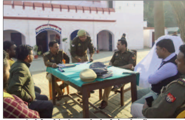
जब वाहनों की नीलामी के दौरान खाली पड़ी मजिस्ट्रेट की कुर्सी अवधि में मजिस्ट्रेट की कुर्सी खाली रही और अन्य अधिकारियों

नीलामी की गई। इस दौरान कमेटी मजिस्ट्रेट, एआरटीओ व क्षेत्राधिकारी की उपस्थिति अनिवार्य है। लेकिन अफसोस पूरी नीलामी