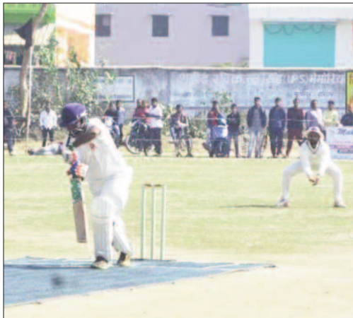
मुजफ्फरपुर और गया के मैच के दौरान गेंद को डिफेंस करता बल्लेबाज।