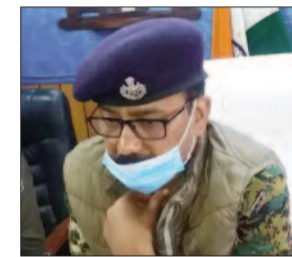
“जिले में शराब तस्करो को पकड़ने और शराब के कारोबार को ध्वस्त करने के लिए सभी थानाध्यक्षों को विशेष निर्देश दिया गया है। जिसके मद्देनजर सभी थाना क्षेत्र में बड़े पैमाने पर छापेमारी और तलाशी अभियान चलाया जा रहा है।”

पुलिस को अमसारी की घटना की यादें ताजा हो गई है। यही कारण है कि पुलिस महकमें पर लग रहे दाम तथा जहरीली शराब से होने वाली मौतों को रोकने के लिए पूरे लाव लश्कर के साथ मैदान में उतर गई है। गुरुवार को पुलिस की कवायदों के बाद यह कहा जा सकता है कि अब पुलिस शराब तस्करो के खिलाफ सबसे बड़ा अभियान चला रही है।