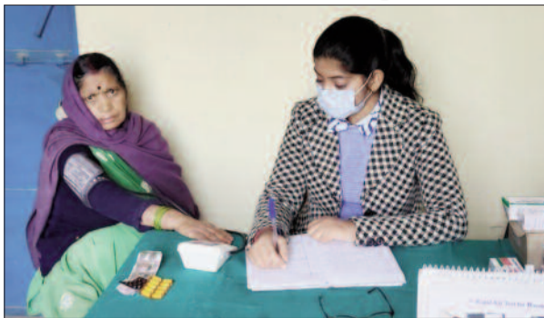
मरीज की जांच करती सीएचओ

इसका लाभ उठा सकें। इस क्रम में स्वास्थ्य विभाग की ओर से सभी संबंधित पदाधिकारियों, चिकित्सकों, सीएचओ, एएनएम व कर्मचारियों को प्रशिक्षण भी दिया जा चुका है।