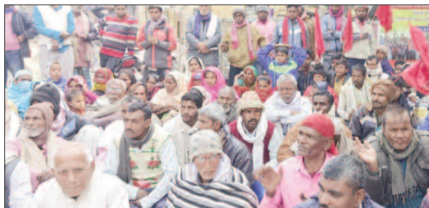
धरना देते माले कार्यकर्ता