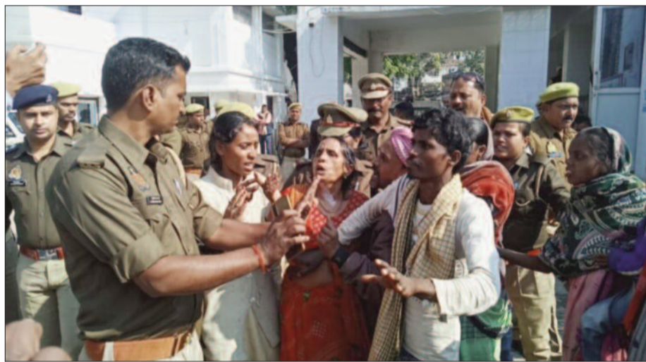
एसपी कार्यालय के समक्ष ग्रामीणों को समझाती पुलिस

जनपद के शहर कोतवाली अंतर्गत रजदेपुर टेढ़वा के पास बीते दिन देर शाम हमलावरों ने ईट-पत्थर से मारकर एक अडेड़ की हत्या कर दी। घटना को अंजाम देकर आरोपी फरार हो गए। सूचना पर मौके पर पहुंची पुलिस ने शव को कब्जे में ले लिया। इस मामले में परिजनों की तहरीर पर चार लोगों के खिलाफ नामजद मुकदमा दर्ज कर पुलिस मामले को छानबीन कर रही है। घटना के बाद आक्रोशित परिजन व ग्रामीण पुलिस कार्यालय के सामने पहुंचकर हमलावरों की गिरफ्तारी की मांग करने लगे। जहां सीओ सिटी ने