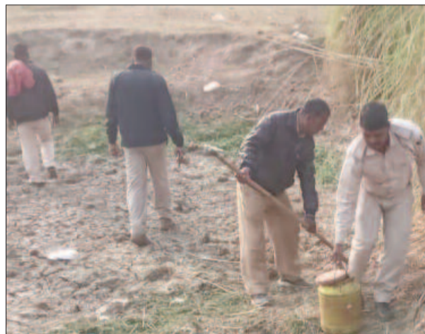
अवैध शराब को जब करते पुलिस जवान

छपरा में जहरीली शराब पीने से चालीस लोगों की मौत के बाद पुलिस अब अलर्ट मोड में आ गई है। गुरुवार को पूरे दिन डुमरांव अनुमंडल के सभी थानों की पुलिस शराब की टोह में छापेमारी करती नजर आई। सभी थानों की टीमों अपने-अपने थाना क्षेत्र में तस्करो के खिलाफ विशेष अभियान चला रही है। बता दें कि छपरा की घटना से राज्य सरकार व पुलिस विभाग की खासी किरकिरी हुई है। मुख्यमंत्री नीतीश कुमार के शराबबंदी कानून पर भी सवाल उठाए जा रहे हैं। वहीं शराब माफियाओं और पुलिस के गठजोड़ की बात भी कही जा रही है। ऐसे में पुलिस अपने दामन को बेदाग करने के लिए अब तस्करो के