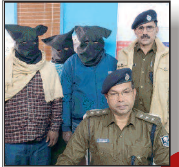
हत्या के प्रतिशोध में बुजुर्ग किसान की पीट-पीटकर हत्या, तीन गिरफ्तार