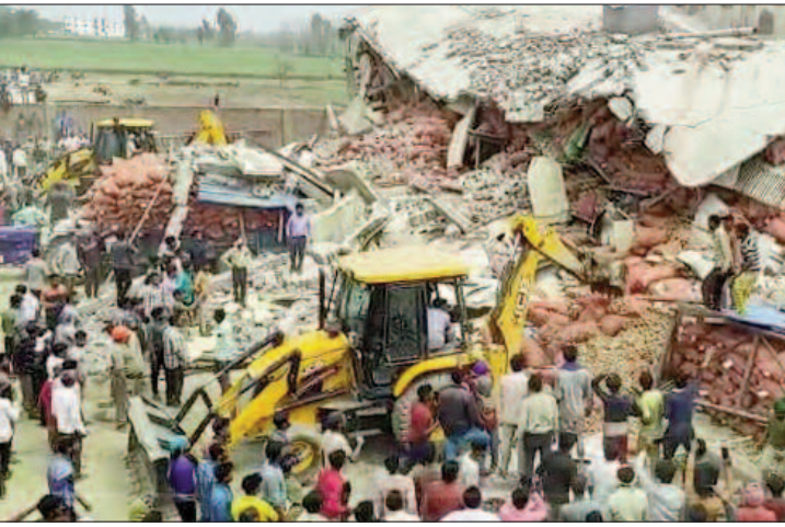
रूप से घायल लोगों को 50 हजार रुपये की हादसे में घायल लोगों को निःशुल्क इलाज सहायता राशि देने के निर्देश दिए हैं। उन्होंने उपलब्ध कराने का निर्देश दिया है।

मुख्यमंत्री योगी आदित्यनाथ ने हादसे में मारे गए प्रत्येक व्यक्ति के परिजनों को दो लाख रुपये का मुआवजा देने की घोषणा की