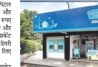
अपनी डेयरी और फल और सब्जियां प्रोसेसिंग कैपेसिटीज के विस्तार के लिए 750 करोड़ रुपए खर्च करने वाले हैं।

नई दिल्ली, एजेंसी। दिल्ली और नेशनल कैपिटल रीजन में प्रमुख दूध सप्लायर मदर डेयरी दो और नए प्लांट्स बनाने के लिए करीब 650 करोड़ रुपए इन्वेस्ट करने जा रही है। नए प्लांटों में कंपनी दूध और फलों को प्रोसेस करेगी। कंपनी इससे बढ़ती माकेट डिमांड को पूरा करेगी। इसके अलावा मदर डेयरी अपनी मौजूदा प्लांटों की कैपेसिटी बढ़ाने के लिए 100 करोड़ और इन्वेस्ट करेगी।