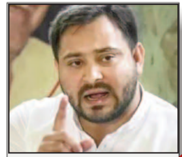
लोकसभा चुनाव में चौकाने वाला रिजल्ट आया: तेजस्वी