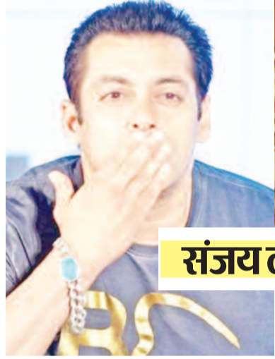
संजय लीला भंसाली की भांजी को