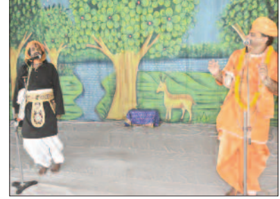
भी मिली जो कृष्ण के दर्शन के लिए वृंदावन जा रही थी। दोनों एक साथ चल पड़े और रास्ते में दोनों ही ठाकुर जी का नाम रटते जा रहे थे। जहां डाकू गोवर्धन कृष्ण को लूटने के उद्देश्य से नाम बार-बार रट रहा था जब बहुत समय बाद वे दोनों वृंदावन पहुंचे तो कई दिन तक कृष्ण को ढूँढ़ते रहे।