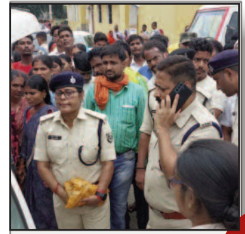
वैशाली में सिपाही को गोली मारकर भाग रहे दो अपराधी एनकाउंटर में डेर