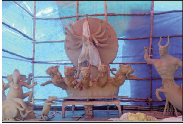
पंडालों में अतिशय मन्यंत्र जरूर रखें तथा भीड़ को संभालने के लिए अपने