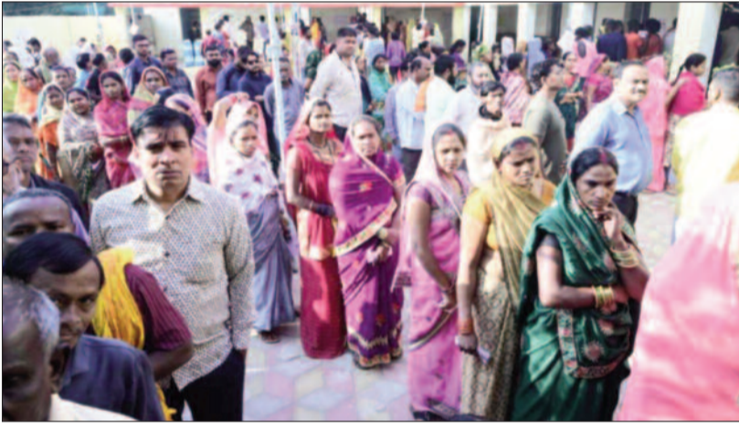
छत्तीसगढ़ में मतदान के दौरान हिंसा, नक्सलियों ने की आगजनी

मध्य प्रदेश के मुख्यमंत्री शिवराज सिंह चौहान ने शुक्रवार को राज्य में जारी वोटिंग के बीच रहेटी में मतदान केंद्र का दौरा किया। इस दौरान सीएम ने प्रचारकों से कहा, मतदान चल रहा है, जनता