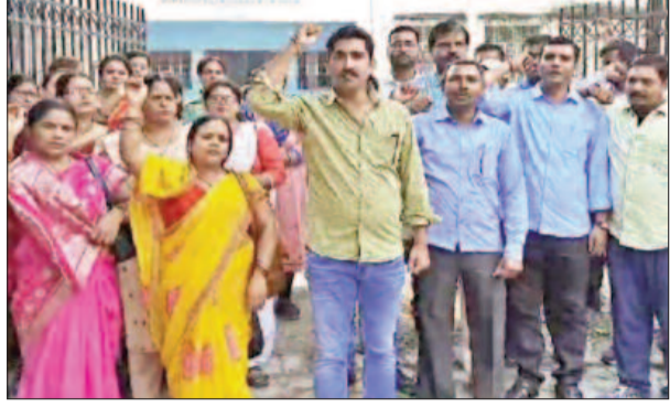
ट्रेनिंग स्थगित करने की मांग को लेकर सोमवार शिक्षकों ने प्रदर्शन किया था।

आपको बता दें कि 21 अक्टूबर 2023 तक सुबह 5.30 बजे से लेकर शाम 7.00 बजे शिक्षकों को ट्रेनिंग दी जानी थी। विभिन्न शिक्षक प्रशिक्षण संस्थानों में आवासीय ट्रेनिंग दी जानी थी। सरकारी शिक्षकों की ट्रेनिंग तारीख पर अपत्ति जताते हुए कहा था कि आवासीय ट्रेनिंग के नाम पर हिंदू सुमदाय के टीचरों को परेशान किया जा रहा है। स्कूलों में