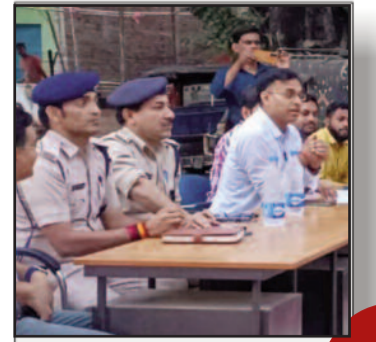
अब 8 नही रात 10 बजे से दुमरांव शहर में होगी टूकों की टूटी