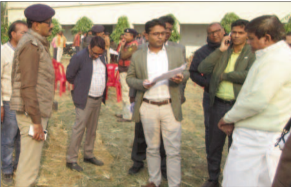
मतदान केंद्र पर पहुंच जानकारी लेते डीएम व एसपी

बक्सर नगर परिषद का बहुप्रतीक्षित चुनाव आज होगा। कुल 1 लाख 14 हजार 399 मतदाता चेयरमैन उप चेयरमैन तथा वार्ड पार्षद प्रत्याशियों के भाग्य का फैसला करेंगे। जिसमें पुरुष मतदाताओं की संख्या 60 हजार 363 है। जबकि महिला मतदाता 54 हजार 35 हैं। बक्सर नगर निकाय चुनाव में एकमात्र थर्ड जेंडर मतदाता भी प्रत्याशियों के भाग्य का विधाता होगा। प्रशासन द्वारा मतदान शांतिपूर्ण कराने के लिए सारी तैयारी पूरी कर ली गई है। कुल 42 वार्डों के लिए कुल 136 मतदान केंद्र बनाये गये हैं। जिसमें मूल मतदान केंद्र की संख्या 42 और सहायक मतदान