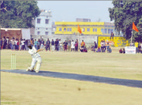
रविकांत एकादश और रांची के बीच मैच का नजारा।

शहीद आईपीएस रविकांत मेमोरियल क्रिकेट प्रतियोगिता का पहला क्वार्टर फाइनल मैच डुमरांव के क्रिकेट प्रेमियों का दिल तोड़नेवाला रहा। शनिवार को डुमरांव के ऐतिहासिक राज हाइस्कूल मैदान पर खेले गए इस मैच में रांची ने मेजबान रविकांत एकादश को एकतरफा अंदाज में आठ विकेट से हराकर सेमीफाइनल में प्रवेश किया। रांची के कप्तान ने टॉस जीते हुए पहले गेंदबाजी करने का फैसला किया। रांची की कसौ गेंदबाजी के आगे रविकांत एकादश के बैट्समैन दबाव में नजर आए। इसी का नतीजा रहा कि पूरी टीम 20वें ओवर में 115 रनों पर ही ढेर हो गई। रविकांत की तरफ से