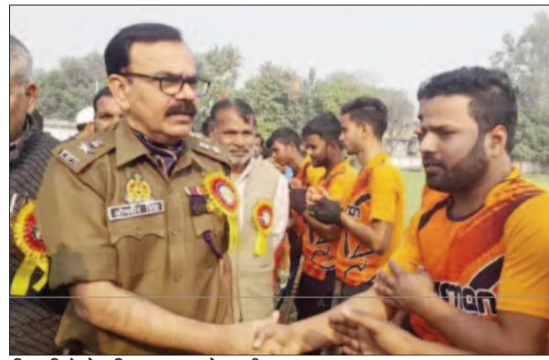
खिलाड़ियों से परिचय प्राप्त करते एसपी व अन्य

दूसरा मैच शिवकाल भैरव एकेडमी अटगावां सैदपुर एवं विवेक हॉकी एकेडमी वाराणसी के मध्य खेला गया। जिसमें शिवकाल भैरव एकेडमी अटगावां दो-शून्य से विजयी रही।