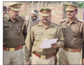
घन से बनाई गई दो अचल संपत्ति जिसकी कीमत आठ करोड़ है को कुर्क किया गया।