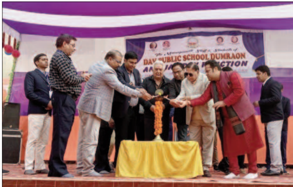
कार्यक्रम का उद्घाटन करते अतिथिगण व विद्यालय के अधिकारी

है। उन्होंने बच्चों से कहा कि सारी भाषा सीख लेना कहीं भी जाना और कहीं भी रहना। लेकिन भारतीय सभ्यता और संस्कृति को कभी मत छोड़ना। पूरी दुनिया में भारत की सभ्यता और संस्कृति सबसे अधिक समृद्ध है। इसे अपनाने वाला हमेशा उच्च स्थान पाएगा।