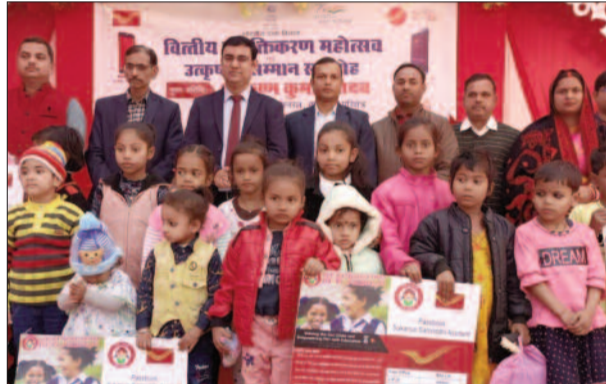
लाभार्थी बच्चों व लोगों के साथ डाक विभाग के अधिकारी

डाक विभाग अब पत्र व पारसलों के साथ-साथ सरकार की तमाम जनकल्याणकारी योजनाओं और इनके लाभों को भी लोगों तक पहुंचा रहा है। वित्तीय सशक्तिकरण और अंत्योदय में डाक विभाग की अहम भूमिका है। एक ही छत के नीचे तमाम सेवाएं उपलब्ध कराकर डाकघरों को बहुदेशीय बनाया गया है। बचत, बीमा, आधार, पासपोर्ट, कॉमन सर्विस सेंटर, इंडिया पोस्ट पेमेंट्स बैंक, गंगाजल बिक्री, न्यूआर कोड आधारित डिजिटल भुगतान जैसे तमाम जनोन्मुखी सुविधाएं डाकघरों में उपलब्ध हैं।