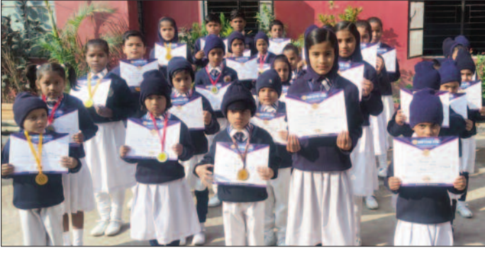
तथा प्रत्येक कक्षा में अब्जल आनेवाले छात्रों को मेडल, ट्रॉफी तथा सर्टिफिकेट दिया जाता है। ताकी छात्रों का मनोबल बढ़े और अधिक से अधिक छात्र बेहतर करने का प्रयास करें। उन्होंने कहा कि इसके अलावा जो छात्र विद्यालय परिसर में अंग्रेजी में बात