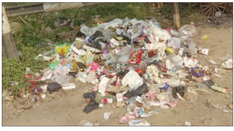
बेकाम हो गया हो लेकिन उसमें से निकलने वाले खतरनाक रसायन व कीटाणु संक्रमण फैला सकता है। लोगों का कहना है कि अक्सर जहरीले कचरे से झुग्गी-झोपड़ी में रहने वाले बच्चे कबाड़ चुनते हैं और यहां से प्लास्टिक के सामानों को चुनकर उसे बेचते हैं और अपना जीविकोपार्जन करते हैं। ऐसे बच्चे बायोमेडिकल कचरा के संपर्क में आकर बीमार पड़ सकते हैं। जानकारी को माने तो इलाके में कई निजी अस्पताल का संचालन होता है और वहां से निकले कचरे निस्तारण के बदले जहां-तहां फेंक दिया जाता है। यह कचरा ज्यादा

◆ सड़क किनारे चाटों में फेंका गया है रुई, सुई, कटा हुआ प्लास्टर, ग्लूकोज की बोतलें तथा कई तरह की दवाइयां