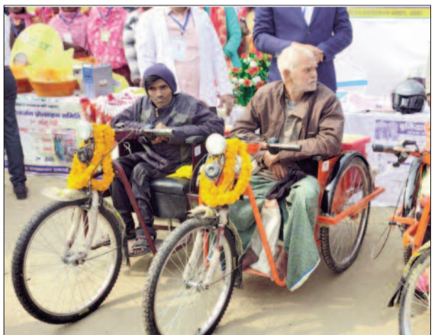
कार्यक्रम के दौरान दिव्यांगजनों के बीच ट्राइसाइकिल का वितरण किया गया।