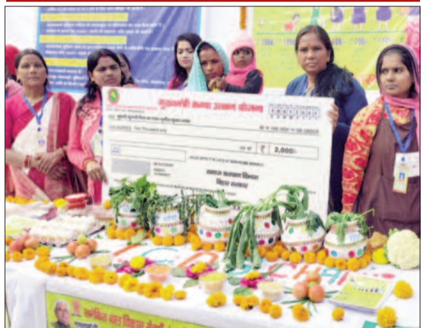
बक्सर में जीविका दीवियों को दिया गया चेक।