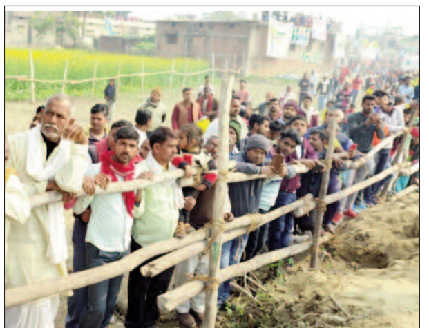
मुख्यमंत्री को देखने के लिए कठार गांव में लगी लोगों की भीड़।