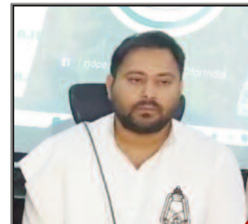
तेजस्वी यादव ने केंद्र सरकार पर साधा