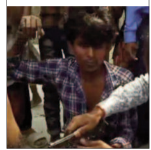
फरार हो गए। पकड़े गए अपराधियों की पहचान मुजफ्फरपुर जिले के

दरभंगा जिले के बिशनपुर थाना क्षेत्र के गोधाइला गांव से एक सीएसपी संचालक से बाइक सवार चार अपराधियों ने पिस्तौल के बल पांच लाख रुपये लूटकर फरार हो गए। बताया जा रहा है कि भाग रहे अपराधियों में से दो को ग्रामीणों ने खदेड़कर पिस्तौल के साथ पकड़ लिया। लेकिन बाकी दो बाइक सवार अपराधी रुपये से भरा थैला लेकर