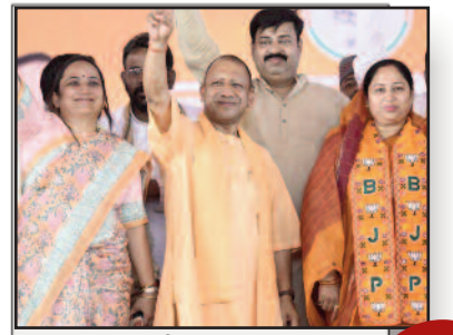
फिल्म सिटी का केंद्र बनेगा आजमगढ़, निकलेंगे ढेरों निरहुआ: सीएम योगी