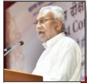
जब तक जिंदा है तब तक बीजेपी से दोस्ती बरकरार रहेगी: नीतीश