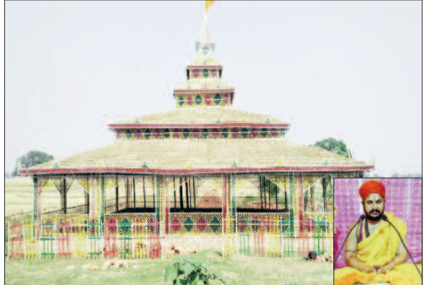
निर्माणधीन यज्ञ मंडप