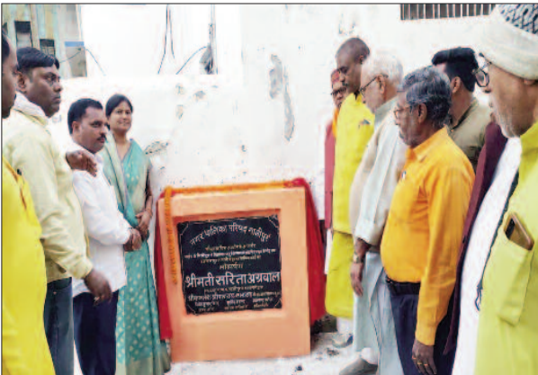
कार्यक्रम में शामिल अधिकारी व नेतागण

नगर पालिका परिषद गाजीपुर द्वारा लोकार्पण का सिलसिला लगातर जारी है। उसी क्रम में सुभाष नगर वार्ड नंबर पांच में नवनिर्मित दो सड़कों का लोकार्पण मुख्य अतिथि भाजपा के प्रदेश कार्यसमिति के