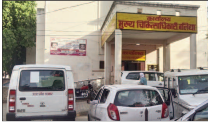
गंभीर मामले में शुरू हुई जांच के बाद जिला चिकित्सालय के जिम्मेदारों के होश फाख्खा रहे। शनिवार को जांच करने पहुंचे एडी हेल्थ आजमगढ़ ने सीएमओ कार्यालय में