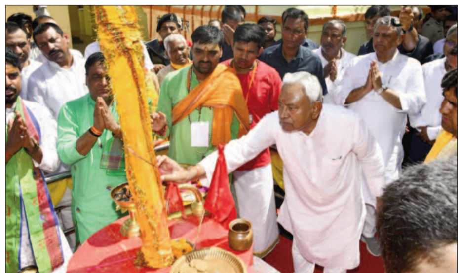
बुधवार को राजगीर में वैदिक मंत्रोच्चारण के बीच पूजा-अर्चना करते मुख्यमंत्री नीतीश कुमार।

◆ सीएम नीतीश बोले... ऐसी मान्यता है कि मलमास के दौरान राजगीर में 33 करोड़ देवी-देवता वास करते हैं, इस कारण इसे पवित्र माना जाता है