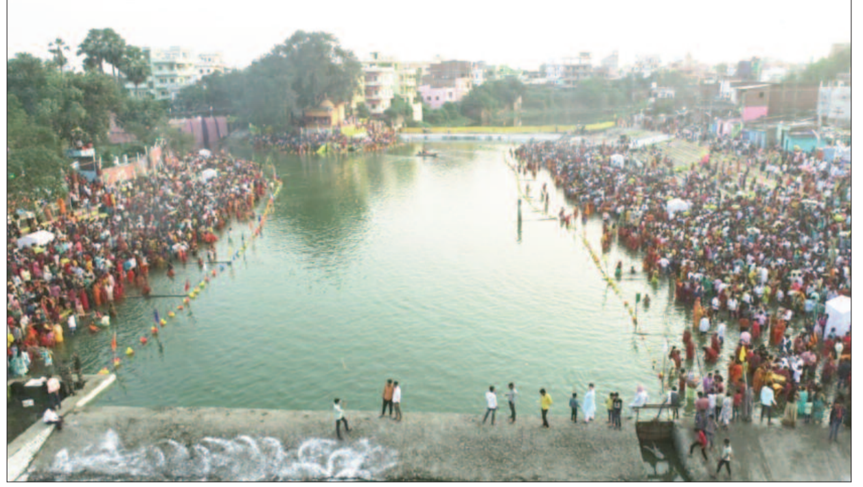
महापर्व छठ पर भगवान भास्कर को अर्घ्य देने के लिए गोह देवकुंड में छठव्रतियों की भारी भीड़ उमड़ी। इस दौरान सुरक्षा के पुख्ता इंतजाम किए गए थे।