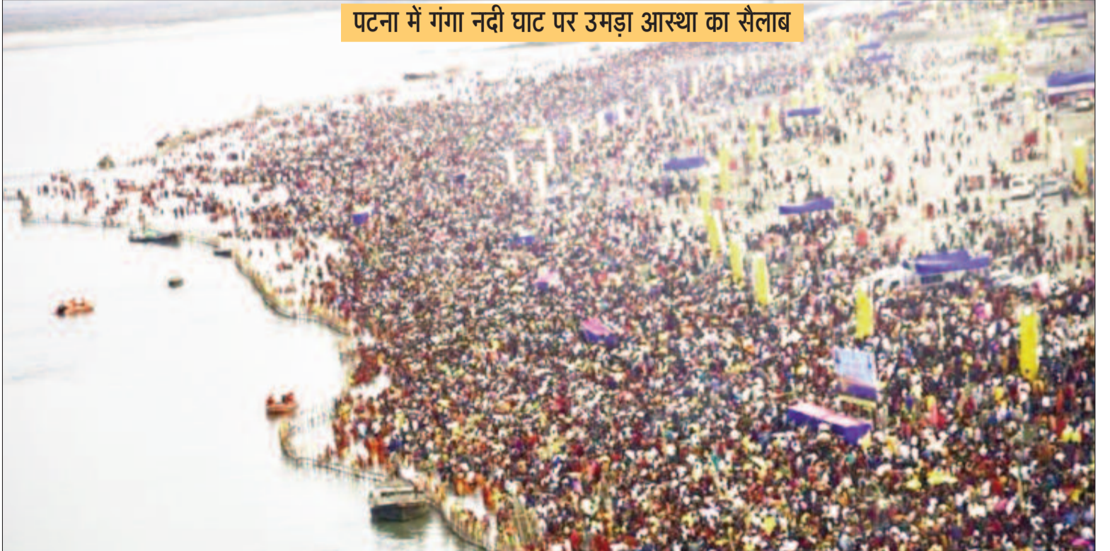
पटना में गंगा नदी घाट पर उमड़ा आस्था का सैलाब

को अर्घ्य दिया। चारों ओर छठ मैया के गीत गुंजते रहे। बिहार के गंगा तटों सहित विभिन्न नदियों किनारे, पोखर और सरोवरों पर लाखों व्रतियों ने उगते सूर्य को अर्घ्य दिया और सबकी खुशहाली की कामना की। उप मुख्यमंत्री तेजस्वी यादव ने सोमवार की सुबह पटना के छठ घाटों का स्टीमर से मुआयना किया।