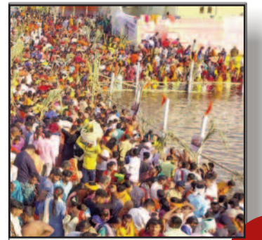
देवदुंड में एक लाख व्रतियों ने भगवान भास्कर को दिया अर्घ्य