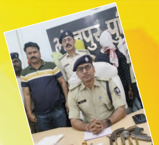
रुलाना : यूट्यूब देख कर की बैंक में डाक डालने की प्लानिंग, चार गिरफ्तार