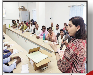
डुमरांव में जनगणना 2027 कार्यों का डीएम ने किया औचक निरीक्षण, पारदर्शिता व शुद्धता पर दिया जोर

प्रमुख खबरें : दिल्ली ■ पटना ■ बक्सर ■ शाहाबाद ■ मगध