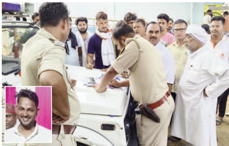
दो साल पहले हुई थी शादी, हत्या से घर में मचा कोहराम