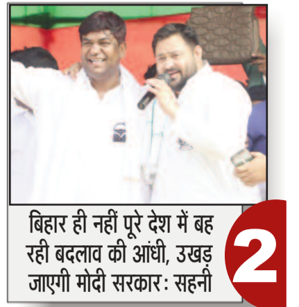
बिहार ही नहीं पूरे देश में बह रही बदलाव की आधी, उखड़ जाएगी मोदी सरकार: सहनी