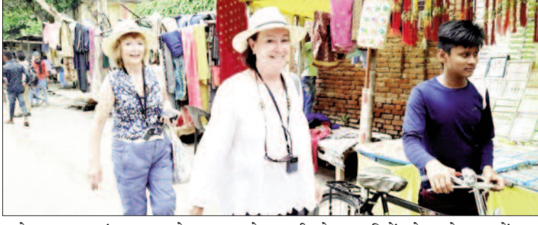
कलेक्टर घाट पहुंचा था। कलेक्टर घाट से सभी सोलह यात्रियों को प्राइवेट वाहनों द्वारा

गंगा नदी में सोलह अंतर्राष्ट्रीय पर्यटकों में ज्यादातर अमेरिकन सैलानियों को लेकर अल सुबह भोर में करीब चार बजे यह क्रूज