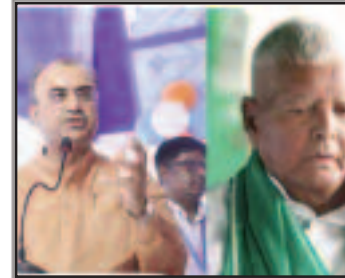
लालू यादव पांच-पांच मामलों में सजायापता के बाद भी राष्ट्रीय अध्यक्ष