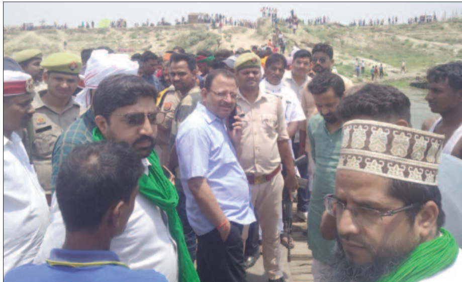
घटना के बाद जानकारी लेने पहुंचे जिलाधिकारी व स्थानीय लोग