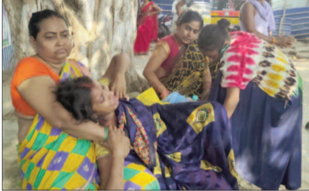
घटना के बाद घर में मचा कोहराम, परिजनों का रो-रोकर है बुरा हाल