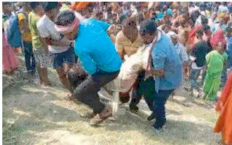
हादसे के बाद डूबे हुए लोगों को नदी से बाहर निकालते स्थानीय गोताखोर

मुंडन एवं दाह-संस्कार आदि के लिए लोग बड़ी संख्या में आते रहते हैं, इस दौरान डूबने अथवा नाव पलटने जैसी दुर्घटनाओं की सम्भावना निरंतर बनी रहती है, इस प्रकार की दुर्घटनाओं में जान-माल की क्षति होती है। डूबने अथवा नाव पलटने जैसी दुर्घटनाओं के बाद व्यक्तियों को ढूँढने के लिए वाराणसी अथवा अन्य जनपदों से सहायता बुलानी पड़ती है, जिसमें काफी समय लग जाने से व्यक्ति को जीवित बचने की सम्भावना शून्य हो जाती है। अतः आपसे अनुरोध है की बलिया जनपद में दुर्घटना होने पर त्वरित राहत प्रदान करने हेतु स्थायी जल पुलिस चौकी अथवा राज्य आपदा प्रबंधन दल की एक टुकड़ी की तैनाती कराने की कृपा करें जिससे भविष्य में होने वाली दुर्घटनाओं में होने वाली क्षति को निम्न किया जा सके।