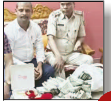
8 साल की नौकरी में खड़ी कर दी सात करोड़ रुपये की संपत्ति