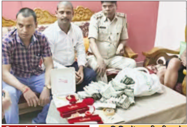
शिकंजे में भ्रष्ट अफसर