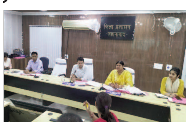
लंबित अतिक्रमण के मामलों का जल्द से जल्द निस्तारण का दिया आदेश

डीएम ने भू-लगान वसूली पर असंतोष व्यक्त करते हुए इस कार्य को प्राथमिकता पर रखते हुए प्रगति लाने के लिए सचन अभियान चलाकर लोगों को जागरूक करते हुए कार्य करने का निर्देश दिया। साथ