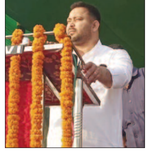
कि वर्ष 2020 के विधानसभा चुनाव के दौरान उन्होंने 10 लाख लोगों को रोजगार देने का वादा किया था और अपने केवल 17 महीने के कार्यकाल

यादव के कार्यक्रम को लेकर कार्यकर्ताओं का उत्साह चरम पर था। तेजस्वी यादव ने बिहार के मुख्यमंत्री नीतीश कुमार को निशाने पर लिया। उन्होंने सीएम पर राज्य में बिना किसी दृष्टिकोण के शासन करने और बिना किसी कारण गठबंधन सहयोगियों को बदलने का आरोप लगाया। तेजस्वी यादव ने कहा कि जनता का विश्वास तथा समर्थन इंडी गठबंधन के साथ है और आगामी लोकसभा चुनाव में यह गठबंधन शानदार प्रदर्शन करेगा। यहां के लोगों से आशीर्वाद मांगा है। यादव ने कहा