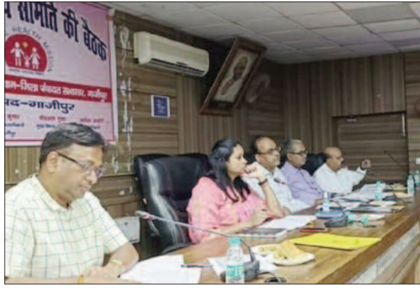
समीक्षा के दौरान मुहम्मदाबाद सीएचसी के समस्त स्टाफ को अच्छे कार्य के लिए प्रशस्ति पत्र देकर सम्मानित किया गया। बैठक में उन्होंने 108 एम्बुलेंस को निर्देश दिया कि निर्धारित समय से अधिक समय न लें। समस्त सीएचसी, पीएचसी पर सीसी टीवी कैमरा का संचालन

की अध्यक्षता में जिला स्वास्थ्य समिति की बैठक कलेक्ट्रेट सभागार में शुक्रवार को सम्पन्न हुई। जिसमें जननी सुरक्षा योजना कार्यक्रम के तहत महिलाओं को निःशुल्क भोजन, दवा एवं ड्रप बैंक की सुविधा, ओपीडी एवं अन्य बिन्दुओं पर समीक्षा करते हुए आवश्यक निर्देश दिए। आयुष्मान गोल्डेन कार्ड समस्त अधीक्षक एवं एमओवाईसी को अभियान चलाकर लक्ष्य पूरा करने का निर्देश दिया। समीक्षा के दौरान उन्होंने कहा कि हेल्थ वेलनेस सेंटर पर आवश्यक दवाओं की उपलब्धता रहे, ओपीडी का संचालन तथा नियमित रूप से सीएचओ एवं एनएम की उपस्थिति का निर्देश दिया।