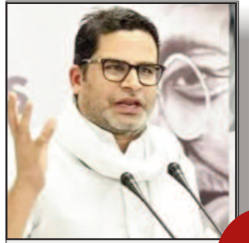
शराबबंदी और राजद के कारण बिहार में बढ़ रहा अपराध: पीके