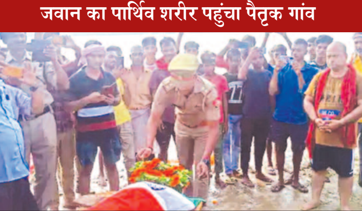
जवान का पार्थिव शरीर पहुंचा पैतृक गांव

शहीद के सम्मान में गाई ऑफ ऑनर के साथ 24 राउंड फायर कर दी गई सलामी केटी न्यूज (बलिया)। बलिया के शहीद बीएसएफ