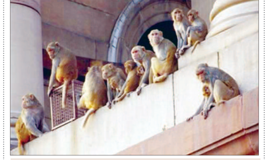
बंदरों का आतंक : भोजन की तलाश में बंदर अब घरों व दुकानों में आतंक मचाना चालू कर दिया है।