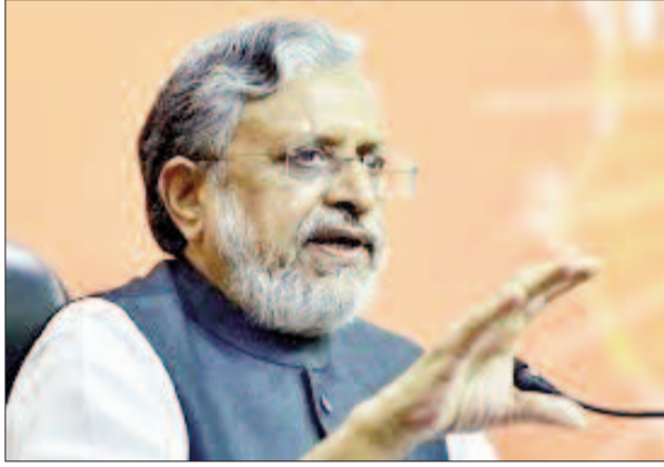
पत्र के माध्यम से भाजपा नेता व बिहार के पूर्व उच्च मुख्यमंत्री सुशील कुमार मोदी को जान से मारने की धमकी दी गई थी। डाक के जरिए

मुजफ्फरपुर जेल को ब्लास्ट कर उड़ाने की दे चुका है धमकी