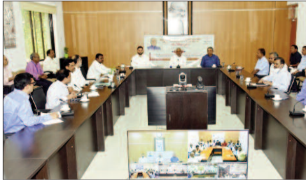
वीडियो कॉन्फ्रेंसिंग करते सीएम, डीपी सीएम व अन्य

मुख्यमंत्री नीतीश कुमार ने आज 11 अग्रे मार्ग स्थित 'संकल्प' से वीडियो कॉन्फ्रेंसिंग के माध्यम से वर्ष 2022 में राज्य के सूखा प्रभावित जिलों के प्रभावित परिवारों को विशेष सहायता के वितरण कार्य का रिमोट द्वारा शुभारंभ किया। राज्य के 11 सूखाग्रस्त जिलों के 96 प्रखंडों के 937 पंचायतों के 7841 राजस्व ग्रामों एवं इसके अंतर्गत आनेवाले सभी गांव टोलों तथा बसावटों के सभी प्रभावित परिवारों को विशेष सहायता के रूप में ग्रेजुएटस रिलीफ (जीआर) की राशि 3500 रुपये प्रति परिवार की दर से उनके बैंक खाते में हस्तांतरित की जा रही है। त्योहारों के पहले बड़ी सौगात देते हुये