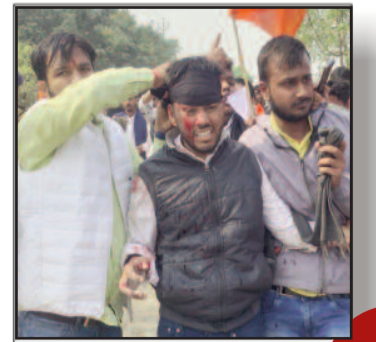
रणक्षेत्र बना वीर कुंवर सिंह विवि, छात्रों के बवाल पर पुलिस का लाठीचार्ज