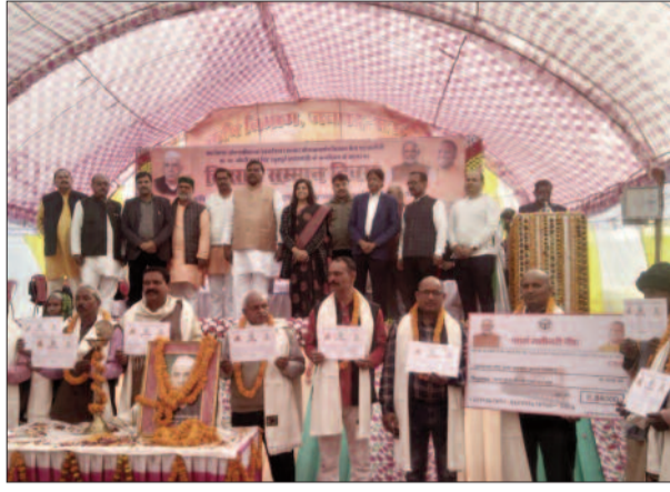
किसान मेला में विभिन्न विभागों द्वारा लगाए गए स्टालों का अवलोकन किया गया। किसानों का और आगे आने के लिए प्रेरित किया गया।