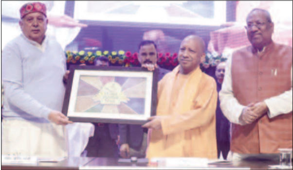
योगी बोले... चौधरी साहब कहते थे कि जब तक किसान गरीब रहेगा, भारत अमीर नहीं हो सकते

सीएम योगी आदित्यनाथ ने पूर्व प्रधानमंत्री चौधरी चरण सिंह की जयंती पर शनिवार को किसान सम्मान दिवस के अवसर पर लोकभवन में ये बातें कहीं। सीएम ने यहां किसान मित्र एआई ऐप का शुभारंभ किया और कृषकों, कृषि उद्यमियों, एफपीओ व कृषि वैज्ञानिकों का सम्मान भी किया। कार्यक्रम में लघु फ़िल्म दिखाई गई। सीएम ने किसानों की सशक्ता विकास यात्रा पुस्तिका का विमोचन भी किया। सीएम ने उत्तर प्रदेश सरकार की ओर से किसानों को दी जा रही सुविधाओं की भी चर्चा की।