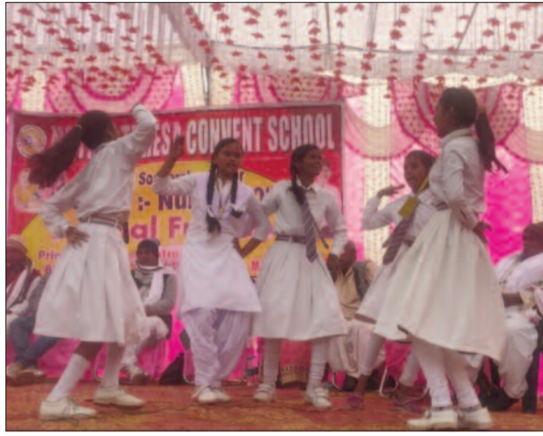
कार्यक्रम में प्रस्तुति देती स्कूली छात्राएं