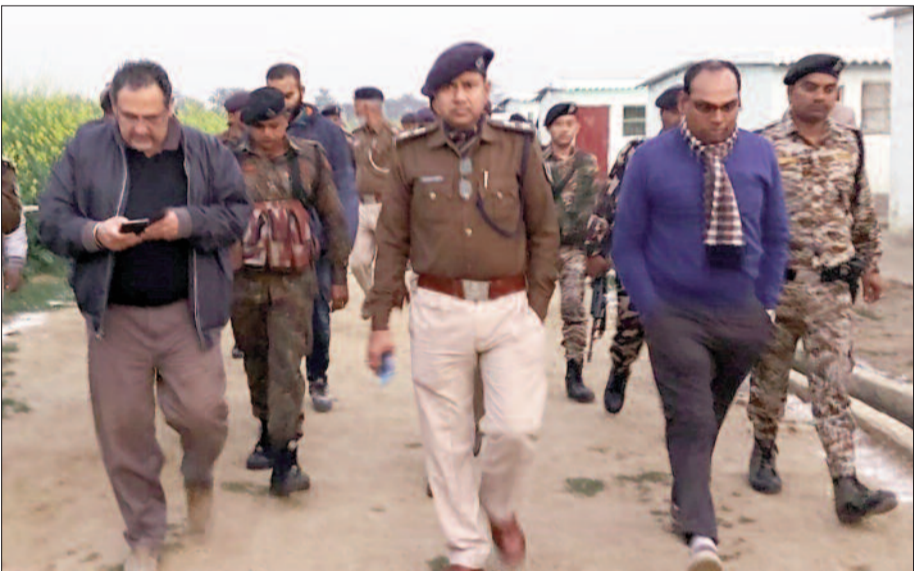
बैठक से पूर्व जायजा लेते एसपी, कंपनी के सीईओ व अन्य अधिकारी केटी न्यूज/चौसा

पिछले तीन महीने से मुआबजा की मांग पर चौसा में धरना दे रहे किसानों के आड़ में कुछ लोगों द्वारा जानबूझकर कंपनी का काम रोकना जा रहा है। जिससे थर्मल पावर प्लांट को हर दिन करोड़ों रूपए का नुकसान हो रहा है। लेकिन किसानों के आड़ में थर्मल पावर का काम रोकने वालों की मनमानी अब नहीं चलने वाली है। कंपनी की शिकायत पर बक्सर पुलिस इस मसले पर कार्रवाई करेगी है।