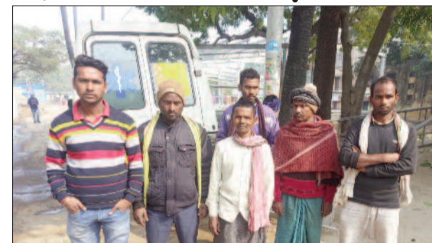
घटना के बाद बच्चे के शव को अस्पताल लेकर पहुंचे परिजन

करीब दो घंटे तक अफरातफरी मची रही और आवागमन बाधित रहा। बाद में सड़क हादसे की सूचना पर पहुंची पुलिस द्वारा काफी मशक्कत कर लोगों को समझाकर शांत कराया गया। तब जाकर लोगों का गुस्सा शांत हुआ और सड़क जाम समाप्त हो सका। उसके बाद पुलिस द्वारा शव का पोस्टमार्टम कराया गया। पोस्टमार्टम के बाद शव सौंपा गया।