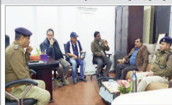
बैठक करते एसपी, कंपनी के सीईओ व अन्य अधिकारी

इधर कंपनी सीईओ ने कहा कि कई स्थानीय मजदूर उपद्रव के बाद से ही काम पर नहीं आ रहे हैं। जिससे कंपनी का काम प्रभावित हो रहा है। उन्होंने कहा कि सोमवार तक काम पर नहीं लौटने वाले स्थानीय मजदूरों को हटा उनके जगह दूसरे मजदूरों को रखा जाएगा। वैसे सूत्रों की मानें तो आंदोलनकारी किसानों के दबाव में ही स्थानीय मजदूर कंपनी नहीं जा पा रहे हैं। हालांकि अब मजदूर भी उनका दबाव मानने से इंकार कर रहे हैं। मजदूरों का तर्क है कि या तो उन्हें काम पर जाने दिया जाए या फिर उनकी मजदूरी दी जाए। जानकारों की मानें तो कंपनी के इस निर्देश के बाद स्थानीय मजदूरों में अपनी नौकरी जाने का भय बना हुआ है।