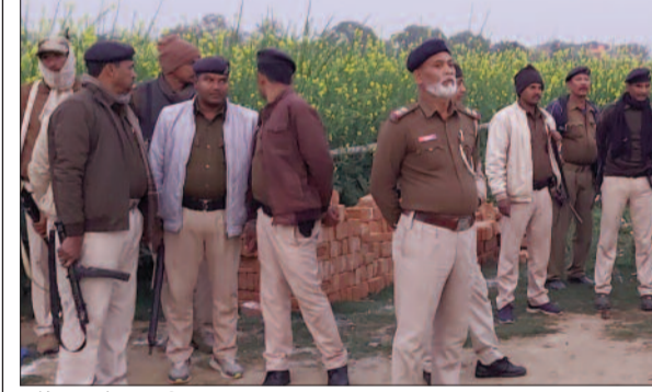
मौके पर तैनात पुलिस जवान

इधर कंपनी सीईओ ने कहा कि कई स्थानीय मजदूर उपद्रव के बाद से ही काम पर नहीं आ रहे हैं। जिससे कंपनी का काम प्रभावित हो रहा है। उन्होंने कहा कि सोमवार तक काम पर नहीं लौटने वाले स्थानीय मजदूरों को हटा उनके जगह दूसरे मजदूरों को रखा जाएगा। वैसे सूत्रों की मानें तो आंदोलनकारी किसानों के दबाव में ही स्थानीय मजदूर कंपनी नहीं जा पा रहे हैं। हालांकि अब मजदूर भी उनका दबाव मानने से इंकार कर रहे हैं। मजदूरों का तर्क है कि या तो उन्हें काम पर जाने दिया जाए या फिर उनकी मजदूरी दी जाए। जानकारों की मानें तो कंपनी के इस निर्देश के बाद स्थानीय मजदूरों में अपनी नौकरी जाने का भय बना हुआ है।