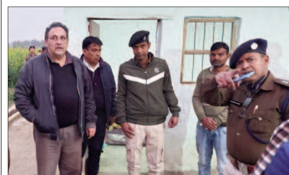
एसपी, कंपनी के सीईओ व अन्य अधिकारी