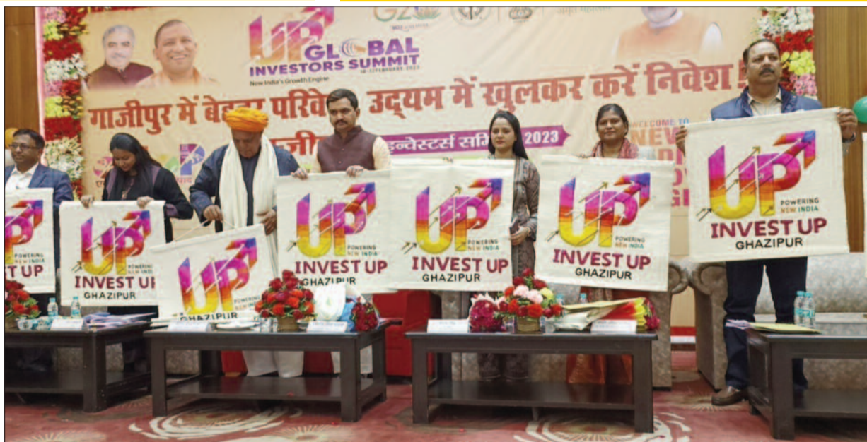
इन्वेस्ट गाजीपुर का लोगो जारी करते जनप्रतिनिधि, अधिकारी व अन्य

बलिया सांसद विरेन्द्र सिंह मस्त ने प्रमुख उद्यमियों व अधिकारियों का स्वागत करते हुए कहा कि देश की निर्माण में उद्योगपतियों की बहुत बड़ी भूमिका रही है। उद्योगपति देश के निर्माण को लेकर आजारी तक कायम करने में आजतक संलग्न रहे हैं। उद्योगपति हमारे देश के बहुत महत्वपूर्ण हिस्सा हैं। देश, शासन एवं प्रशासन और सामाज्य तीनों के संयुक्त प्रयासों से आगे बढ़ता है। हम भारत सरकार एवं उत्तर प्रदेश सरकार तथा गाजीपुर प्रशासन के तरफ से भरोसा दिलाते हैं कि गाजीपुर के विकास के मार्ग में