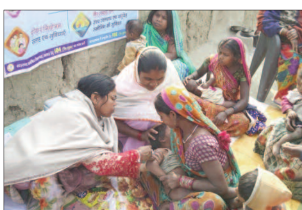
शिशु में बच्चे को टीका देती एएनएम करने की प्रक्रिया शुरू कर दी गई है। लोगों के बीच सामंजस्य बना किया जा रहा टीकाकरण :

देखा जा रहा है। हालांकि नियमित टीकाकरण को लेकर लगातार जागरूकता अभियान के साथ साथ टीकाकरण भी किया जा रहा है। खासकर खसरा और रूबेला जैसी खतरनाक बीमारी को जड़ से मिटाने के लिए केंद्र सरकार ने कमर कस ली है। दिसंबर 2023 तक इसे जड़ से मिटाने के लिए मुहिम शुरू है। इसके तहत रोहतास जिले में खसरा रूबेला टीकाकरण से वंचित बच्चों की पहचान कर टीकाकरण भी शुरू कर दिया गया है। जिले में 2200 के आसपास ऐसे बच्चे पाए गए, जो प्रथम और दूसरे टीका से वंचित थे। वैसे बच्चों को नियमित टीकाकरण एवं कैंप के माध्यम से टीकाकृत