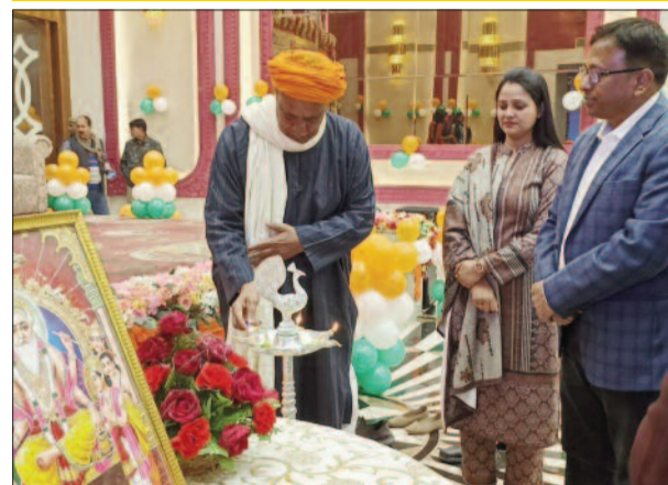
कार्यक्रम का उद्घाटन करते सांसद व अन्य

जिलाधिकारी ने अपने संबोधन में कहा कि गाजीपुर में आने पर मुझे बहुत खुशी और हर्ष का विषय है। मुख्यमंत्री जी के विजन के अनुरूप उत्तर प्रदेश में 10-12 फरवरी को इन्वेस्टर्स समिट लखनऊ में आयोजित की जा रही है। जिसमें देश के उद्योगपति इन्वेस्ट करेंगे। उसी के क्रम में आज जनपद गाजीपुर में इन्वेस्टर्स समिट आयोजित की जा रही है। ये धरती तपस्वियों व ऋषियों की रही है। यहां से ज्यादा से ज्यादा संख्या में लोग