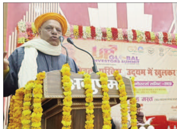
कार्यक्रम का उद्घाटन करते सांसद व अन्य

लोगों को संबोधन करते सांसद समझकर पुलिस से यही अपेक्षा की है कि कानून व्यवस्था में सुधार हो जिसमें आज उत्तर प्रदेश की सुरक्षा व्यवस्था में सुधार हुआ है। माननीय मुख्यमंत्री जी का विजन है कि गाजीपुर में सुरक्षा व्यवस्था प्राप्त हो इसके लिए पुलिस कार्यालय में इन्वेस्टमेंट सेल की भी स्थापना किया गया है। जिसमें जनपद के विभिन्न क्षेत्रों में जो कार्य उद्यमी कर रहे हैं। उन्हें अगर कोई समस्या हो तो अवगत कराए ताकि उसका निस्तारण कराया जा सके। सभी बाहर से आए हुए उद्यमी अपना उद्योग स्थापित करें कोई भी समस्या होगी तो पुलिस प्रशासन आपके सहयोग में हमेशा तत्पर रहेगा।