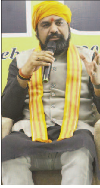
कॉन्क्लेव में बोलते डिप्टी सीएम सम्राट चौधरी।

कार्यक्रम में उपस्थित बिहार के उप मुख्यमंत्री सम्राट चौधरी ने कहा कि यह बदलाव का दौर है, बिहार में मेधा की कमी नहीं है। जिस कारण बिहार की भविष्य काफ़ी सुखमय होने जा रहा है। उन्होंने कहा कि हमारे पास गौरवशाली इतिहास रहा है। यहां के शासकों ने नालंदा, तक्षशिला व विक्रमशिला जैसे विश्व विख्यात विश्वविद्यालयों की स्थापना की थी। उन्होंने कहा कि मगध सम्राज्य का काल पूरे हिन्दुस्तान का स्वर्णिम काल था। उन्होंने कहा कि बिहार में लेदर उद्योग, आईटी सेक्टर तथा इंडस्ट्री क्षेत्र में तेजी से काम हो रहा है। नेताओं को सत्ताभोगी नहीं बनना होगा बल्कि काम करना होगा। विकसित बिहार बनाने के लिए पांच गुना