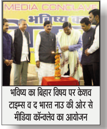
भविष्य का बिहार विषय पर केशव टाइम्स व द भारत नाउ की ओर से मीडिया कॉन्फ्लेव का आयोजन