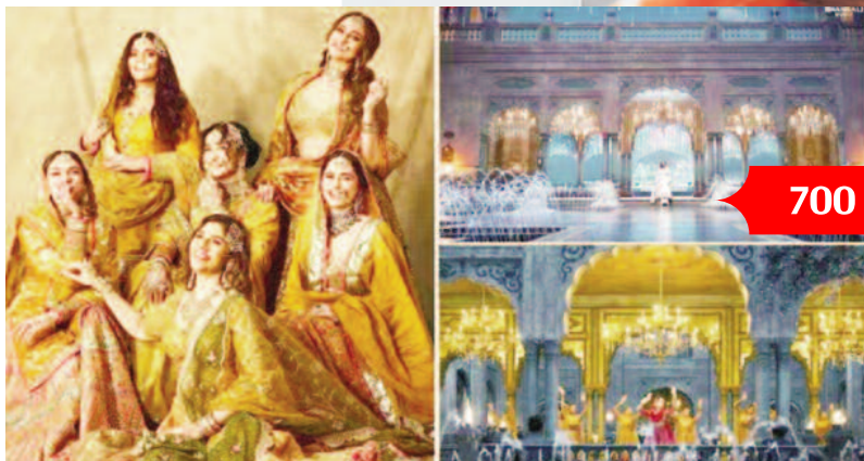
700 कारीगरों ने तैयार किया सेट