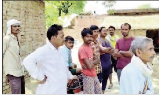
परिवार के लोगों को मिला युवती का शव

◆ सगाई के दिन घर से 200 मीटर पर आशिक के भ्रूसे के घर में मिला शव ◆ मां बेटी के हाथों में मेहंदी लगाने की कर थी इंतजार खून से लथपथ मिला बेटी शव