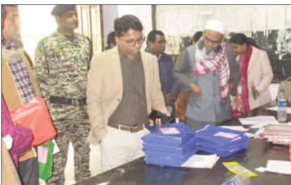
प्रश्न पत्र की सील जांच करते डीएम व अन्य

बिहार स्टाफ सलेक्शन कर्मिशन द्वारा आहूत स्नातक स्तरीय तृतीय परीक्षा शुक्रवार को जिले के 15 केन्द्रों पर कड़ी सुरक्षा व्यवस्था के बीच शुरू की गई। यह परीक्षा शनिवार को भी आयोजित की जाएगी। पहले दिन दोनों पालियों की