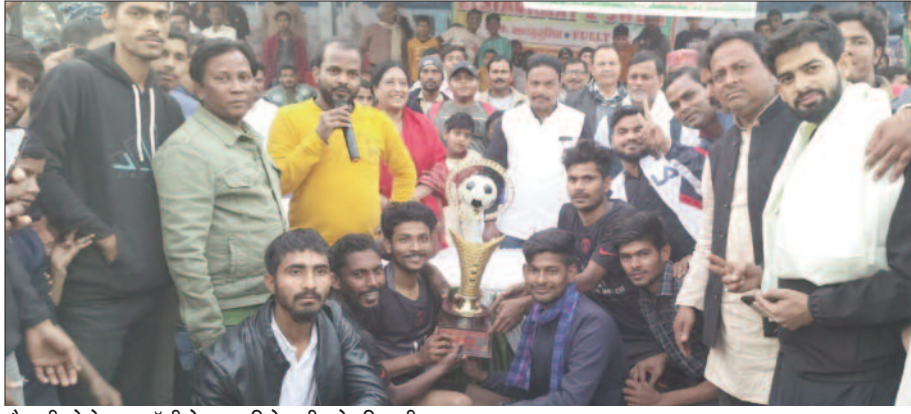
मैच जीतने के बाद ट्रॉफी के साथ विजेता टीम के खिलाड़ी

मैच के दौरान हजारों की संख्या में दर्शक मौजूद थे तथा प्रत्येक गोल पर पटना के खिलाड़ियों की होसल अफजाई करतल ध्वनियों से कर रहे थे। इस मैच के दौरान डुमरांव में फुटबॉल की दीवानगी भी परवान पर देखी गई। पूरे मैच के दौरान दर्शक