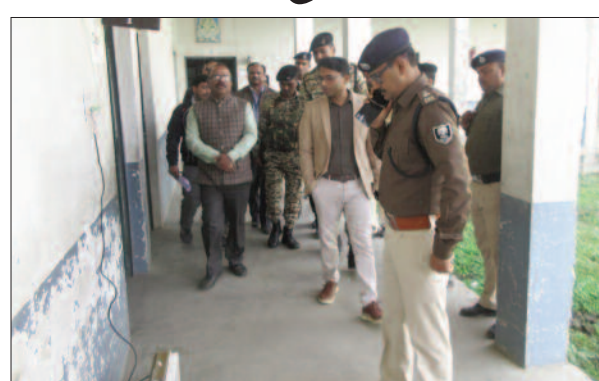
कक्षा के बाहर कैदायीक से जानकारी लेते डीएम व मौजूद एसपी

विधि व्यवस्था संधारण एवं परीक्षा कार्य के सफल आयोजन हेतु जिले में बने विभिन्न केंद्रों का निरीक्षण किया। अधिकारियों ने कैम्ब्रिज सीनियर सेकेंडरी स्कूल, कतकौली