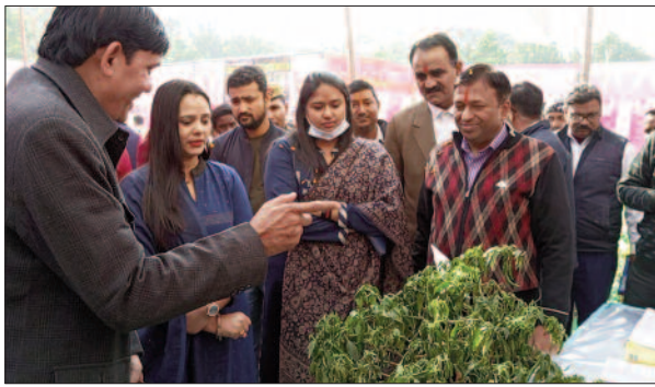
पौधे की जानकारी लेती डीएम व अन्य

जिसमें जिलाधिकारी ने संबोधित करते हुए कहा कि जनपद कृषि प्रधान जिला है। जहां एफपीओ बनाए जाएं, जो किसानों के विकास के लिए फ्लैटफार्म साबित होगा। अभी तक जनपद में पांच एफपीओ ही पंजीकृत हैं, सभी एफपीओ पंजीकृत कराएँ जिसकी फंस मात्र 6500 रुपए है। गुणवत्तापूर्ण उत्पाद का उत्पादन करें, अपने एफपीओ की समस्त अभिलेख दुरुस्त रखें ताकि किसी स्तर पर असुविधा ना हो।